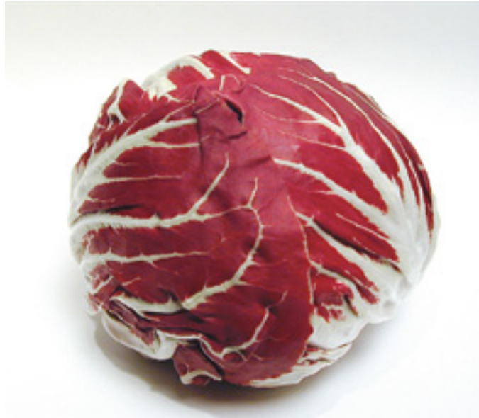
FIGURA 1. Cultivar Rosso di Chioggia.