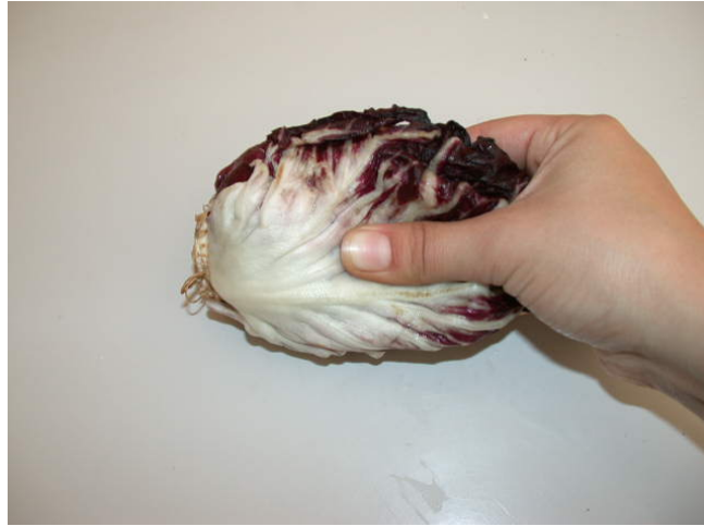
FIGURA 2. Evidente pérdida de peso, que afecta la apariencia y calidad de algunos radicchios variedad coralo R3 después de 30 días de almacenaje refrigerado ( 0^{\circ}\text{C} \pm 1^{\circ}\text{C} y 95% H.R.).